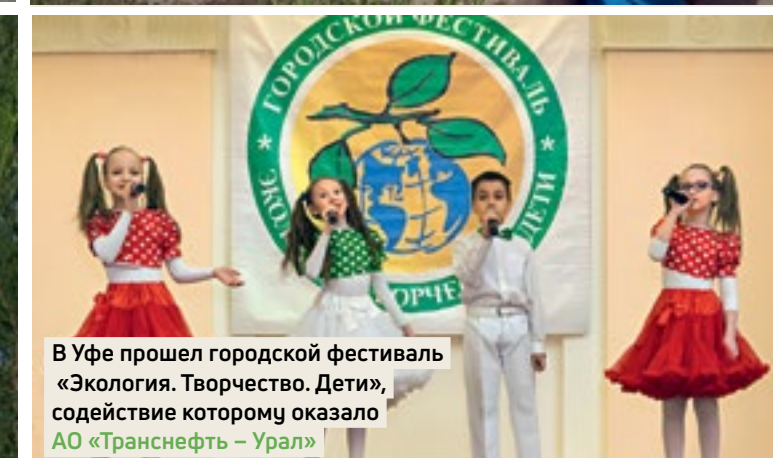
В Уфе прошел городской фестиваль «Экология. Творчество. Дети», содействием которому оказало АО «Транснефть – Урал»