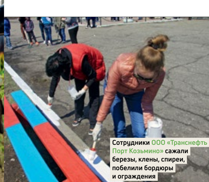
Сотрудники ООО «Транснефть – Порт Козьмино» сажали березы, клены, спиреи, побелили бордюры и ограждения