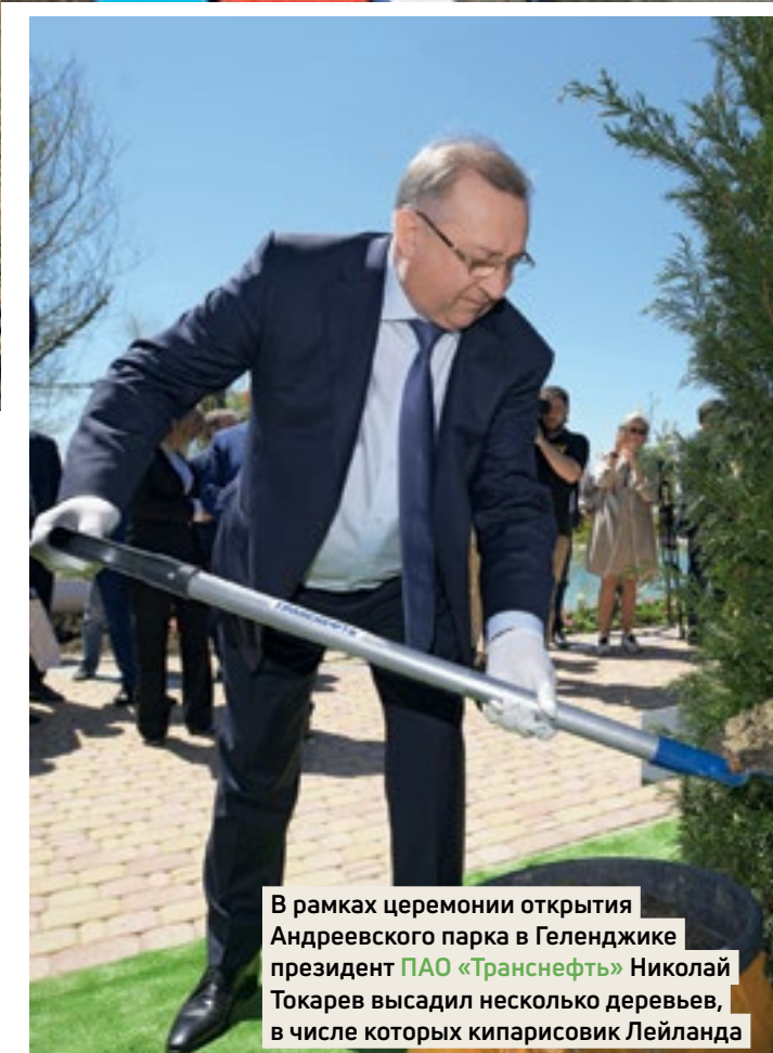
В рамках церемонии открытия Андреевского парка в Геленджике президент ПАО «Транснефть» Николай Токарев высадил несколько деревьев, в числе которых кипарисовик Лейланда