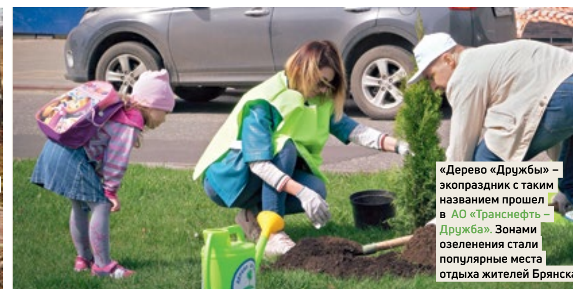
«Дерево «Дружбы» – экопраздник с таким названием прошел в АО «Транснефть – Дружба». Зонами озеленения стали популярные места отдыха жителей Брянска

Участниками экоакций, которые прошли в дочерних обществах «Транснефти», стали тысячи сотрудников компании и члены их семей. В рамках мероприятий не только сажали деревья и убирали прошлогоднюю траву. Новые форматы субботников, мастер-классов, конкурсов включают защиту экопроектов необычного озеленения, фотоквесты, детские фестивали и концерты. Цель акций – привлечение внимания к вопросам экологии и сохранения уникальной природы регионов, по территории которых идут трубопроводы компании.