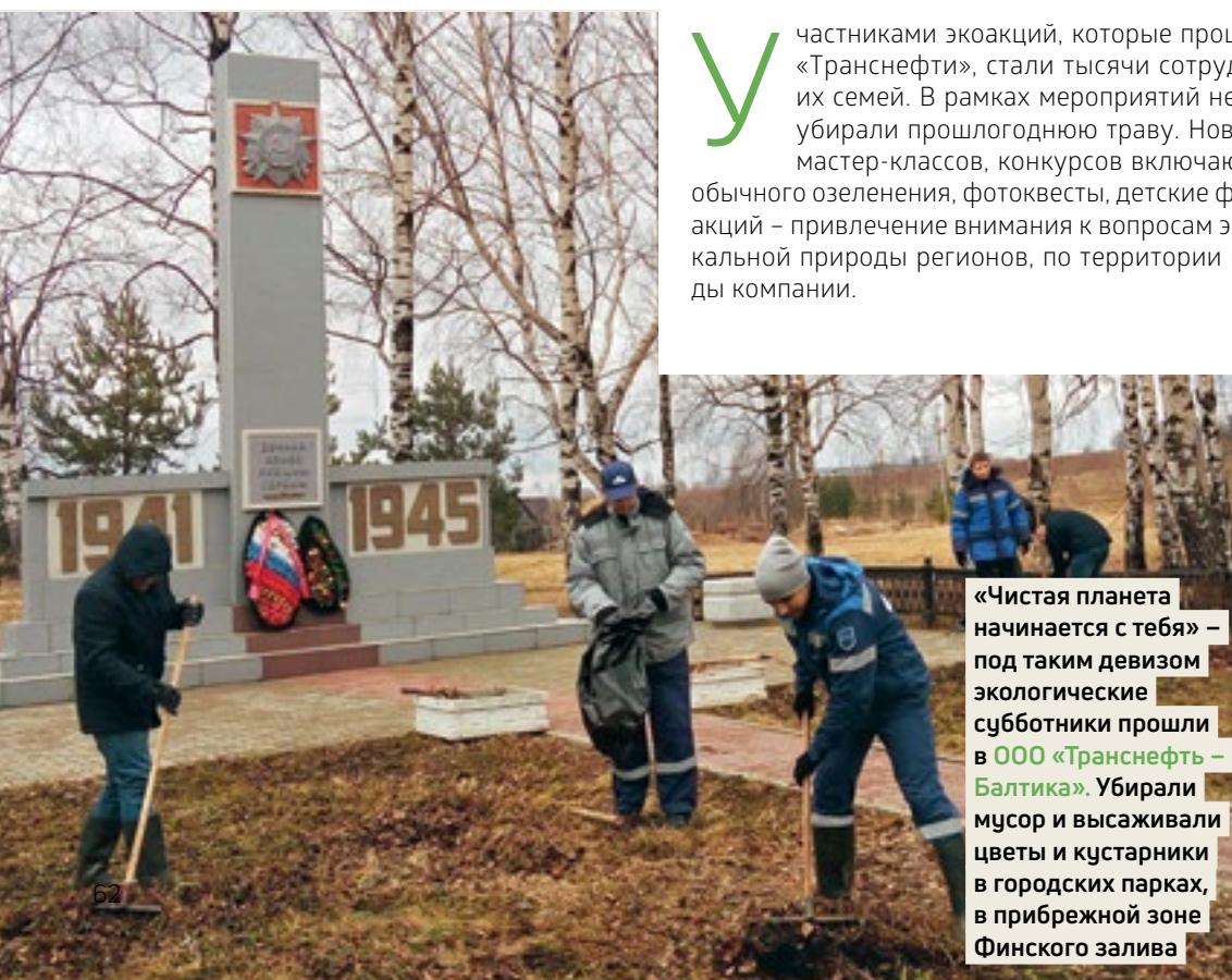
«Чистая планета начинается с тебя» – под таким девизом экологические субботники прошли в ООО «Транснефть – Балтика». Убирали мусор и высаживали цветы и кустарники в городских парках, в прибрежной зоне Финского залива