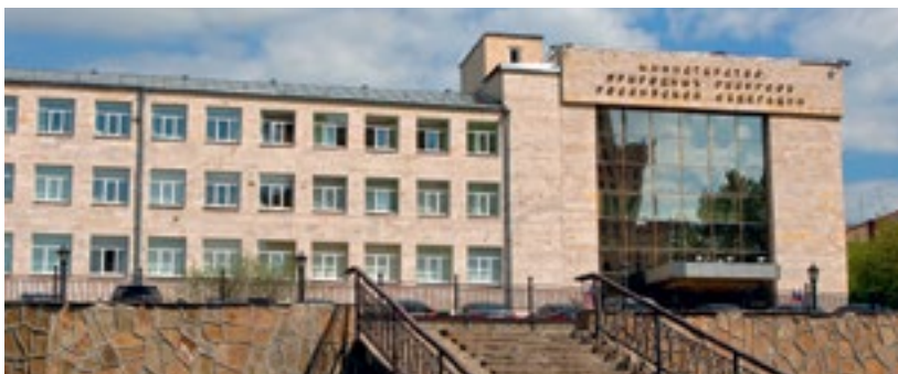
Минприроды РФ готовит поправки в закон «Об охране окружающей среды»

отходами производства и потребления, в том числе уже накопленными за много лет и долгое время наносящими вред окружающей среде. Во-вторых, это предотвращение и снижение негативного воздействия хозяйственной деятельности – через экологическую экспертизу, нормирование, экологический надзор и контроль, охрану атмосферного воздуха, поверхност-